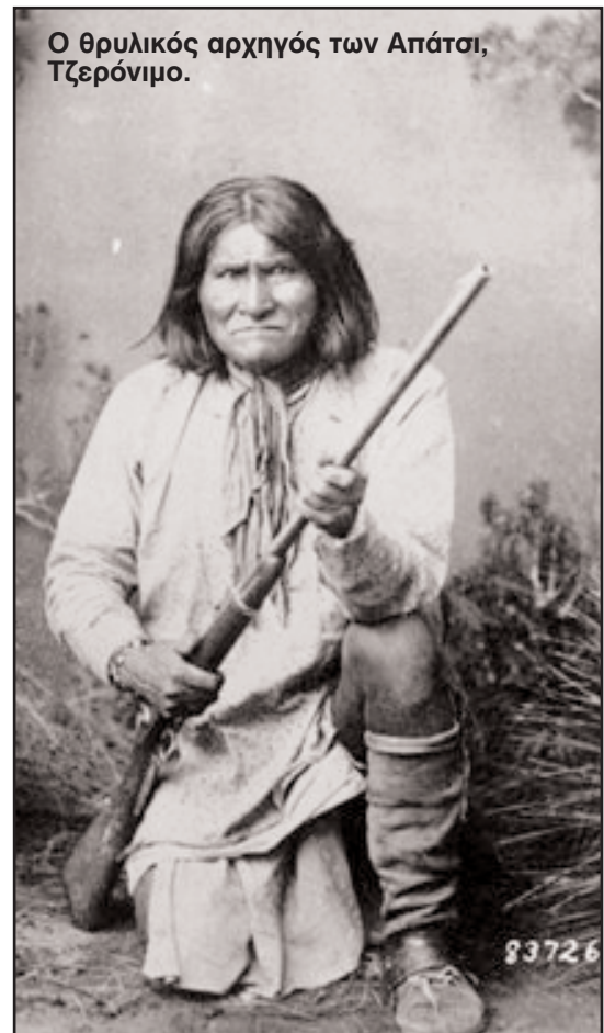
Ο θρυλικός αρχηγός των Απάτσι, Τζερόνιμο.

Ο Τζερόνιμο αγωνίστηκε κατά της αμερικανικής κυβέρνησης για χρόνια: ήταν ο τελευταίος αρχηγός των Ινδιάνων που συγκέντρωσε δυνάμεις και ήρθε σε ευθεία πολεμική αντιπαράθεση με τις κυβερνητικές. Περικλωμένος παραδόθηκε το 1886 και φυλακίστηκε για να πεθάνει έγκλειστος το 1909.