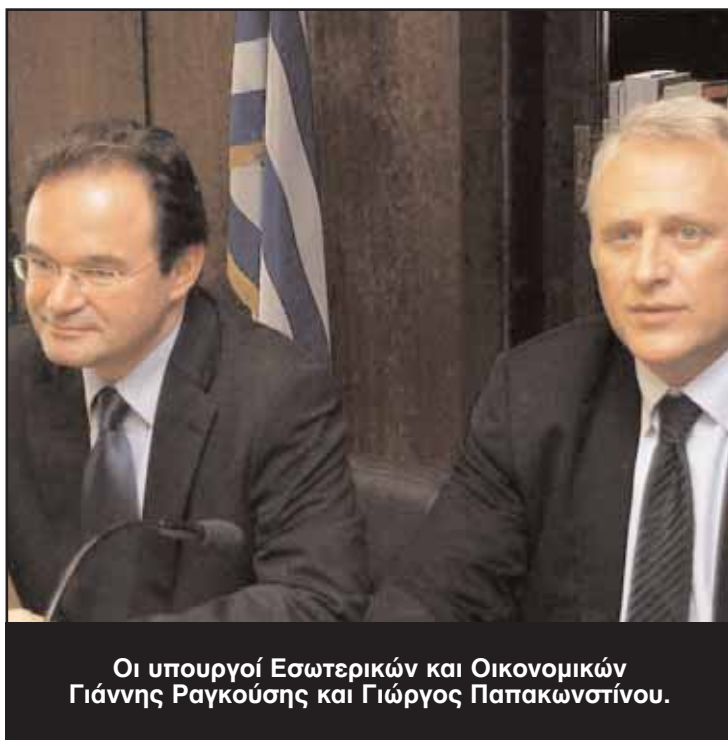
Οι υπουργοί Εσωτερικών και Οικονομικών Γιάννης Ραγκούσης και Γιώργος Παπακωνσταντίνου.

Με βάση τα παραπάνω, οι δύο υπουργοί δήλωσαν ότι οι ΟΤΑ στην Ελλάδα δεν είναι υποχρηματοδοτούμενοι. Όπως χαρακτηριστικά δήλωσε ο κ. Παπακωνσταντίνου, για πρώτη φορά στη δημοσιονομική ιστορία της χώρας «ξέρουμε τις δαπάνες της κεντρικής κυβέρνησης» και επεσήμανε ότι δεν υπάρ-