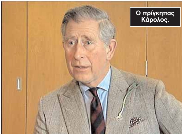
Ο πρίγκιπας Κάρολος.

«Αν η εκπομπή τους βγει στον αέρα, τότε δεν θα σας δώσουμε εικόνα» φέρεται να είπε ο κ. Πάτρικ Χάρισον. Το