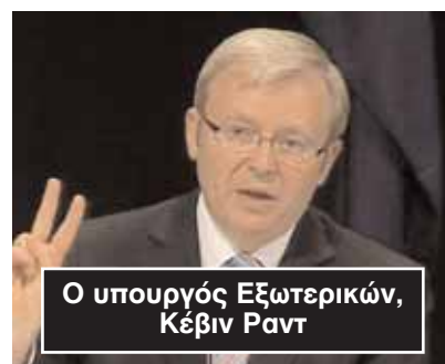
Ο υπουργός Εξωτερικών, Κέβιν Ραντ

Όμως ο πρόεδρος της Συρίας στον ΟΗΕ, Μπασάαρ Άσαδ, δήλωσε κατηγορηματικά πως η