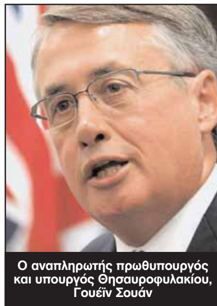
Ο αναπληρωτής πρωθυπουργός και υπουργός Θησαυροφυλακίου, Γουέιν Σουάν

Ο κ. Σουάν τόνισε ότι οι μεγάλες επιχειρήσεις «κινδυνολογούν», αλλά σε τελική ανάλυση όλοι συμφωνούν πως πρέπει να ληφθούν μέτρα για την αντιμετώπιση της κλιματικής αλλαγής. Η βιομηχανία εξόρυξης άνθρακα υπολογίζει ότι ο φόρος θα την επιβαρύνει με $18 δις μέσα στα επόμενα 10 χρόνια.