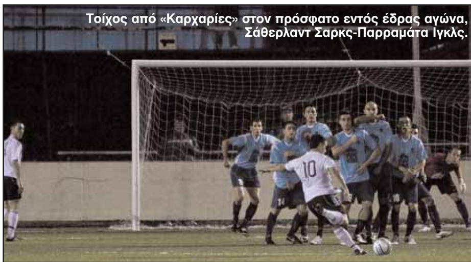
Τοίχος από «Καρχαρίες» στον πρόσφατο εντός έδρας αγώνα, Σάθερλαντ Σαρκς-Παρραμάτα Ιγκλς.