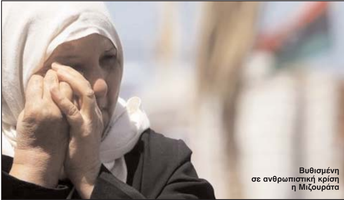
Βυθισμένη σε ανθρωπιστική κρίση η Μιζουράτα

Λουτρό αίματος και ανθρωπιστικό δράμα στη Μιζουράτα της δυτικής Λιβύης από τους αδιάκοπους βομβαρδισμούς των δυνάμεων του Μουαμάρ Καντάφι. Το καθεστώς επανέλαβε τη Δευτέρα τις επιθέσεις με ρουκέτες και πυρά πυροβολικού, 25 άνθρωποι έχουν χάσει τη ζωή τους στο σφυροκόπημα της Κυριακής, ενώ άλλοι τέσσερις σκοτώθηκαν τη Δευτέρα, σύμφωνα με τους αντάρτες. Περισσότεροι από 1.000 οι νεκροί και 3.000 τραυματίες τις τελευταίες εβδομάδες. «Το 80% των νεκρών είναι άμαχοι», είτε ο διοικητής του νοσοκομείου δρ. Χάλεντ Αμπού Φάλγα στους δημοσιογράφους, τονίζοντας ότι τα 60 κρεβάτια του νοσοκομείου είναι κατειλημμένα από τραυματίες.