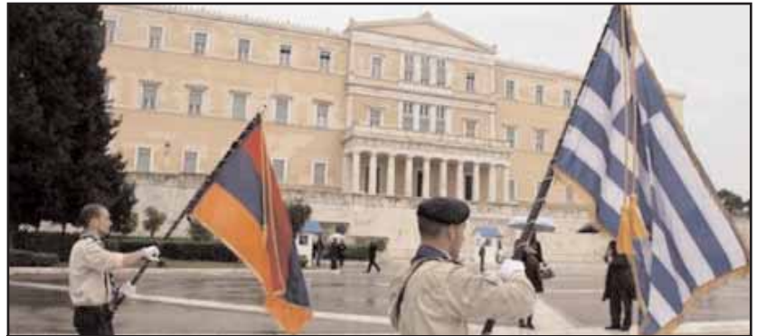
Εκδηλώσεις για την επέτειο της Γενοκτονίας έγιναν και στην Αθήνα

Μετά την εκδήλωση ακολούθησε πορεία και κατάθεση στεφάνων στο Ηρώο του Γ Σώματος Στρατού. Στην Αθήνα πραγματοποιήθηκε κατάθεση στεφάνου στο Μνημείο του Άγνωστου Στρατιώτη.