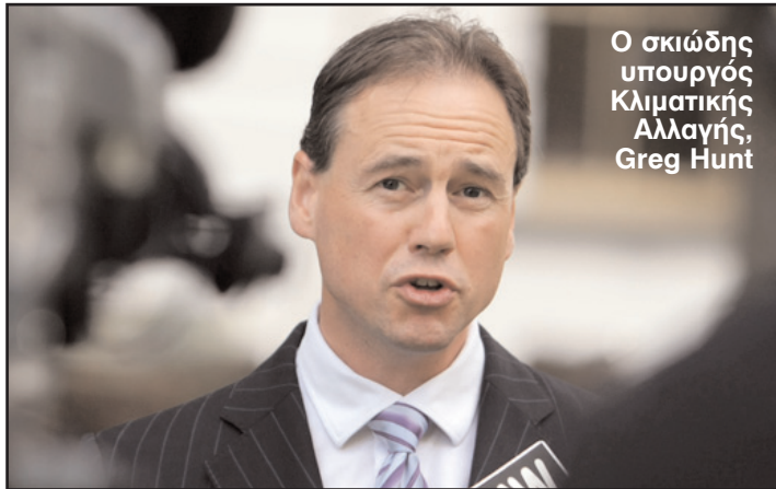
Ο σκωτς υπουργός Κλιματικής Αλλαγής, Greg Hunt

Την δημιουργία Ανεξάρτητης Επιτροπής για εξετάσει προτάσεις για την απλοποίηση του φορολογικού συστήματος, αλλά και την αναθεώρηση των κρατικών δαπανών, προτείνει η ομοσπονδιακή αντιπολίτευση. Ο σκωτς υπουργός Κλιματικής Αλλαγής, Greg Hunt, σε ομιλία του στο Ινστιτούτο του Σίδνεϊ, πρότεινε να ανατεθεί σε Ανεξάρτητη Επιτροπή η εξέταση προτάσεων για φορολογικές μεταρρυθμίσεις, εφόσον όπως είπε, το σημερινό φορολογικό σύστημα είναι ανεπαρκές και επιβαρύνει γραφειοκρατικά την κυβέρνηση και τους εργοδότες. «Η κατεύθυνση που πρέπει να ακολουθήσουμε μέχρι το έτος 2020 - και γιατί όχι μέχρι το 2030 - πρέ-