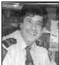
Lic. No: 2ta06709