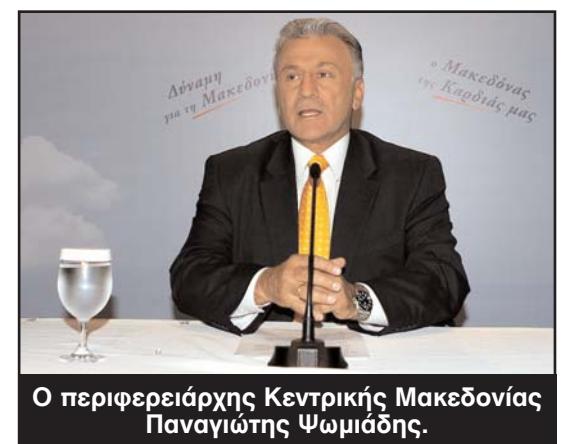
Ο περιφερειάρχης Κεντρικής Μακεδονίας Παναγιώτης Ψωμιάδης.

Σήμερα θα εκδικαστεί στο Εφετείο η υπόθεση της μείωσης προστίμων από τον περιφερειάρχη Κεντρικής Μακεδονίας, Παναγιώτη Ψωμιάδη, σε κρατηριούχο υγρών καισίμων. Πρωτόδικα ο κ. Ψωμιάδης καταδικάστηκε σε ποινή φυλάκισης 12 μηνών με τριετή αναστολή, καθώς κρίθηκε ένοχος για παράβαση καθήκοντος. Η υπόθεση είχε προσδιοριστεί για την Τρίτη στο Πενταμελές Εφετείο Θεσσαλονίκης, αλλά, μαζί με άλλες υποθέσεις, μετατέθηκε τελικά για σήμερα, λόγω παρέλευσης του ωραρίου. Η μείωση των προστίμων έγινε τον Νοέμβριο του 2005, όταν ο κ. Ψωμιάδης ήταν Νομάρχης Θεσσαλονίκης.