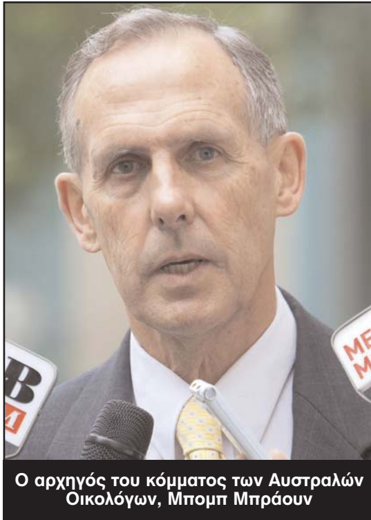
Ο αρχηγός του κόμματος των Αυστραλών Οικολόγων, Μπομπ Μπράουν

Ο αρχηγός των Οικολόγων είπε ότι ζήτησε κατ' ιδίαν συνάντηση με την πρωθυπουργό για να συζητήσουν το όλο θέμα. Μέχρι τότε, πρότεινε στην κα Γκίλαρντ να στρέψει την προσοχή της στην ομοσπονδιακή αντιπολίτευση.