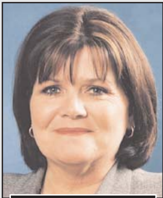
Η Σέλι Χάνκοκ

Μια νέα παράγραφος στην πολιτική ιστορία της Νέας Νότιας Ουαλίας θα γραφτεί εντός των ημερών όταν ο νέος πρωθυπουργός της Πολιτείας, Μπάρι Ο' Φάρελ, θα ανακοινώσει τον διορισμό της πρώτης γυναίκας προέδρου της Βουλής.