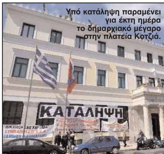
Υπό κατάληψη παραμένει για έκτη ημέρα το δημαρχιακό μέγαρο στην πλατεία Κοτζιά.