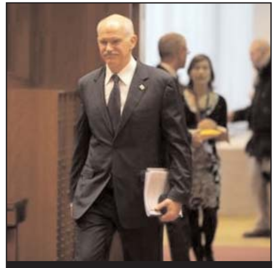
Ο Γιώργος Παπανδρέου στην πρόσφατη συνάντηση των Ευρωπαίων ηγετών την περασμένη Παρασκευή.

Στις συνομιλίες των Ευρωπαίων ηγετών θα τεθούν τα θέματα που αφορούν τη «συνολική λύση» για την κρίση χρέους στην Ευρωζώνη, για τα οποία θα λάβει οριστικές αποφάσεις το Ευρωπαϊκό Συμβούλιο, αλλά και ο πόλεμος στη Λιβύη, καθώς και το πυρηνικό πρόβλημα που έχει προκύψει μετά τις δραματικές εξελίξεις στην Ιαπωνία. Κρίσιμης σημασίας για την Ελλάδα, αλλά και την Ευρωπαϊκή Ένωση, είναι το θέμα που αφορά στην αντιμετώπιση του μεγάλου προβλήματος του χρέους στην ευρωζώνη. Η Ελλάδα αναμένει και επιδιώκει την επικύρωση των αποφάσεων της 11ης Μαρτίου, εκτιμώντας ότι οι όποιες επιφυλάξεις από ορισμένες χώρες, είναι επορευμένες και δεν θα αλλάξουν τα δεδομένα. Σημαντικό θέμα είναι αυτό της αναθεώρησης της συνθήκης, η οποία επίσης αναμένεται να αποφασιστεί και η οποία, στη συνέχεια, θα τεθεί προς έγκριση από τα εθνικά Κοινοβούλια. Θα συζητηθεί επίσης η κρίση στη Λιβύη, με την Ελλάδα να υποστηρίζει την πολιτική διευθέτησή της και να θέτει, μαζί με την Ιταλία, θέμα αντιμετώπισης ενός ενδεχόμενου νέου κύματος μεταναστών. Το τρίτο θέμα που θα απασχολήσει τη Σύνοδο Κορυ-