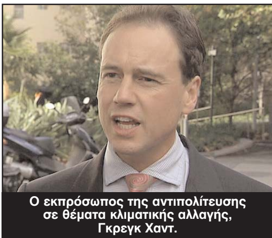
Ο εκπρόσωπος της αντιπολίτευσης σε θέματα κλιματικής αλλαγής, Γκρεγκ Χαντ.

στηρίζει περισσότερο το πρόγραμμα εμπορίας ρύπων ως αποτελεσματικό μέτρο κατά της κλιματικής αλλαγής, παρά την επιβολή του φόρου ρύπανσης.