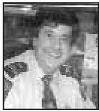
Lic. No: 2ta06709

ΕΙΝΑΙ και αυτοί που για προσωπικούς, παραταξιακούς και άλλους λόγους συντηρούν το Διχασμό αρέσκονται να βλέπουν και φέτος την Εθνική μας Γιορτή να κινείται σε δυο επίπεδα. Αλλά τους πληροφορούμε προς μεγάλη τους λύπη ότι φέτος δεν είναι έτσι ακριβώς. Το έβλεπες και το ένοιωθες στις συναντήσεις των δυο μεγάλων Φορέων της Παροικίας μας, όπου εκείνοι οι σκληροί αντίπαλοι ήσαν φίλοι. Διαπιστώθηκε η θέλησή τους να ανοίξουν οι δρόμοι της Ενότητας στην Ελληνική Παροικία. Ναι, ξημερώνει από φέτος καλύτερη μέρα για τον Ελληνισμό της Παροικίας μας. Και είναι ανάγκη να ξημερώσει. Μπορούμε, παρά τις δυσκολίες, να ΑΙΣΙΟΔΟΞΟΥΜΕ .