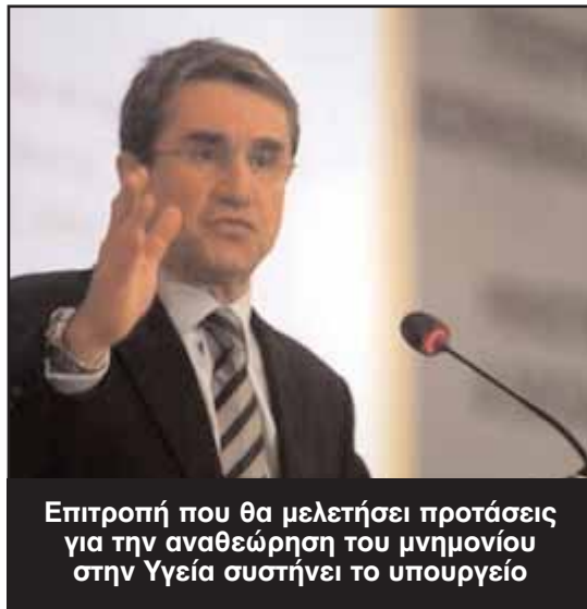
Επιτροπή που θα μελετήσει προτάσεις για την αναθεώρηση του μνημονίου στην Υγεία συστήνει το υπουργείο

Ανεξάρτητη επιτροπή ειδικών εμπειρογνομόνων με στόχο τη σύνταξη προτάσεων για την αναθεώρηση του μνημονίου για τη υγεία, συστήνει ο υπουργός Υγείας κ. Ανδρέας Λοβέρδος. Αποστολή της επιτροπής, όπως αναφέρεται χαρακτηριστικά στη σχετική απόφαση, είναι να υποβάλει τόσο προς την κυβέρνηση όσο και προς την τριόικα, προτάσεις για μία συνολική μεταρρύθμιση του δημόσιου και ιδιωτικού συστήματος υγείας «με στόχο τη διατήρηση της δημόσιας δαπάνης για την υγεία σε ποσοστό του ΑΕΠ μικρότερο του 6%». Το έργο της επιτροπής, που εντάχθηκε ήδη στο πρόγραμμα διοικητικής μεταρρύθμισης του υπουργείου Εσωτερικών και θα χρηματοδοτηθεί με το ποσό των 120.000 ευρώ σε πρώτη φάση, αναμένεται να στηριχθεί απ' όλες τις αρμόδιες υπηρεσίες του κράτους που έχουν σχέση με την υγεία. Συγκεκριμένα, η ανεξάρτητη επιτροπή σε συνεργασία με την Ευρωπαϊκή Επιτροπή, την Ευρωπαϊκή Τράπεζα και το Διεθνές Νομισματικό Ταμείο, υποχρεούται να παραδώσει πόρισμα με την αρχική αξιολόγηση των δράσεων σε πολιτικές που έχουν μέχρι τότε εφαρμοστεί και να καταθέσει προτάσεις στα ακόλουθα θέματα: • Ενοποιημένη διακυβέρνηση του συστήματος υγείας • Χρηματοδότηση του συστήματος υγείας • Εναρμόνιση των παροχών υγείας για τους δικαιούχους όλων των ασφαλιστικών ταμείων • Συνεργασία δημόσιων και ιδιωτικών φορέων παροχής υπηρεσιών υγείας. • Δημιουργία ολοκληρωμένου δικτύου