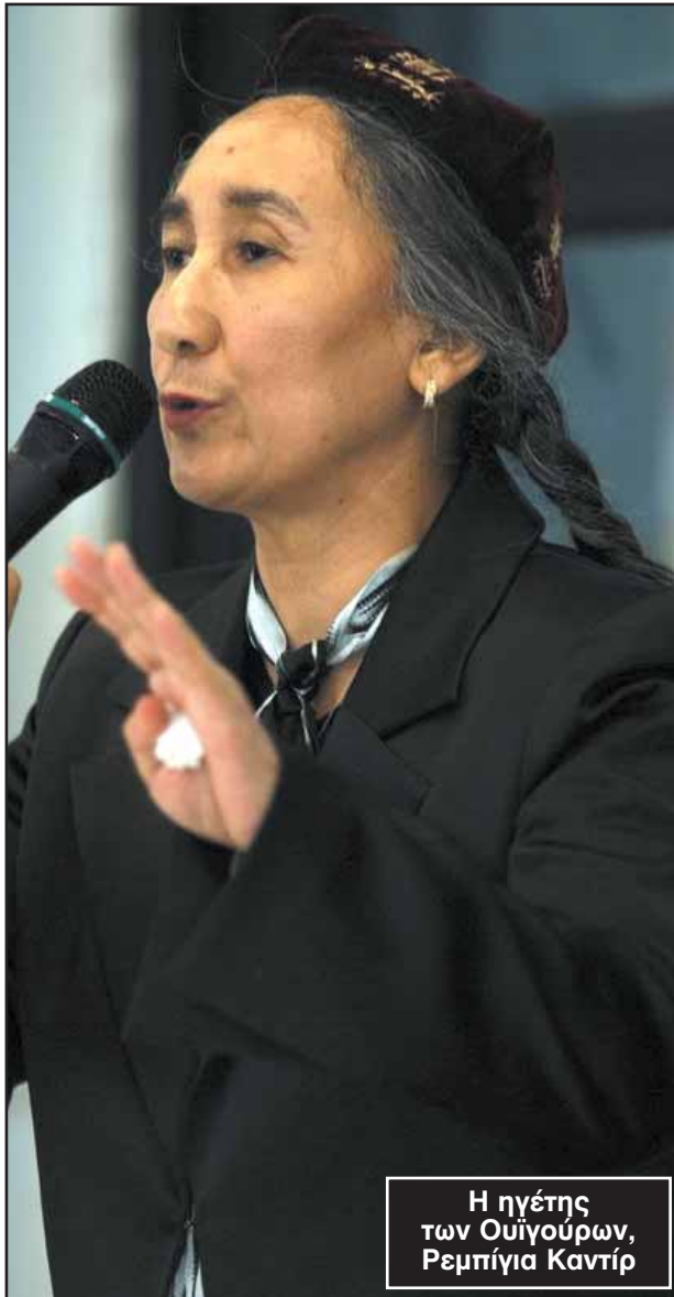
Η ηγέτης των Ουϊγούρων, Ρεμπίγια Καντίρ

Επί σειρά ετών, εξόριστοι Ουϊγούροι αγωνίζονταν για την ίδρυση ενός ανεξάρτητου Ανατολικού Τουρκεστάν στην (πλούσια σε πετρέλαια) Σινγιάνγκ, η οποία συνορεύει με το Πακιστάν και το Αφγανιστάν. Η Κίνα έχει κατά καιρούς εκτοξεύσει κατηγορίες εναντίον οργανώσεων Ουϊγούρων για τρομοκρατικές επιθέσεις (κυρίως μέσα στη δεκαετία του 1990), ενώ έχει υπαινιχθεί σύνδεσή τους με την Αλ Κάιντα.