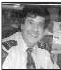
Lic. No: 2ta06709

ΕΥΧΟΜΑΣΤΕ μέσα από την καρδιά μας σε όλους τους Γέροντες και τις Γερόντισσες του Ελληνικού Κοινωνικού Γηροκομείου «Ελληνικό Σπίτι» Δύναμη και Υγεία!