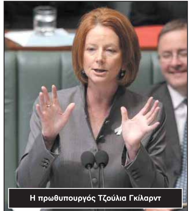
Η πρωθυπουργός Τζούλια Γκίλαρντ

Στη Νέα Υόρκη θα συναντηθεί με τον Γενικό Γραμματέα των Ηνωμένων Εθνών, Μπαν Κι Μουν, στον οποίο θα επαναλάβει την επιθυμία της Αυστραλίας για την εξασφάλιση μη-μόνιμης έδρας στο Συμβούλιο Ασφαλείας, το 2013-2014.