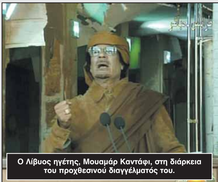
Ο Λίβυος ηγέτης, Μουαμάρ Καντάφι, στη διάρκεια του προχθεσινού διαγγέλματός του.