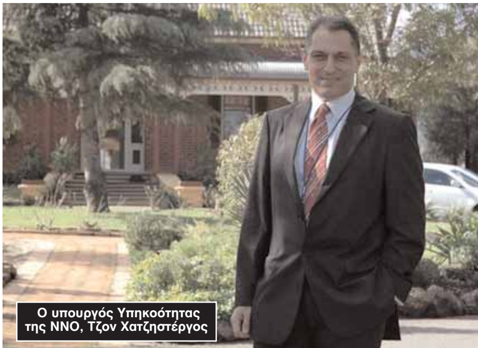
Ο υπουργός Υψηκοότητας της ΝΝΟ, Τζον Χατζηστεργος