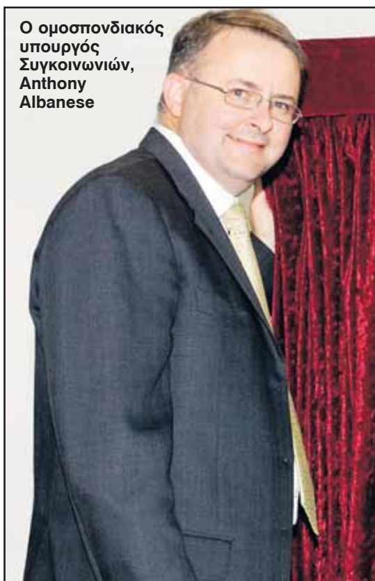
Ο ομοσπονδιακός υπουργός Συγκοινωνιών, Anthony Albanese

Νέα μελέτη αποκαλύπτει ότι οι εκπομπές διοξειδίου του άνθρακος προκαλούν τις πλημμύρες. Δύο Καναδοί επιστήμονες υποστηρίζουν ότι μεταξύ 1951 και 1999 τα φαινόμενα καταρρακτωδών βροχών και πλημμυρών αυξήθηκαν κατά 7% σε όλο το βόρειο ημισφαίριο. Τα αποτελέσματα της έρευνας δημοσιεύονται στο περιοδικό «Nature» και υποστηρίζουν ότι είναι πλέον σαφές πως η ανθρώπινη δραστηριότητα είχε προκαλέσει τα ακραία καιρικά φαινόμενα που γνωρίζει ο πλανήτης τα τελευταία χρόνια. Η μελέτη έγινε μετά τις πρόσφατες καταστροφικές πλημμύρες στο Κουϊνσλαντ και τη Βικτώρια.