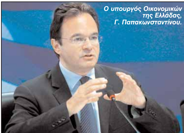
Ο υπουργός Οικονομικών της Ελλάδας, Γ. Παπακωνσταντίνου.

ρυφής θα χαρακτηριστεί ένας οδικός χάρτης για την αντιμετώπιση της κρίσης του ευρωπαϊκού χρέους, με τις τελικές αποφάσεις να λαμβάνονται στη Σύνοδο Κορυφής του Μαρτίου. Θα πρέπει να δοθεί μία ολοκληρωμένη απάντηση στην κρίση χρέους, που σημαίνει περισσότερα χρήματα στο... τραπέζι και χαμηλότερα επιτόκια, όπως είπε ο υπουργός Οικονομικών.