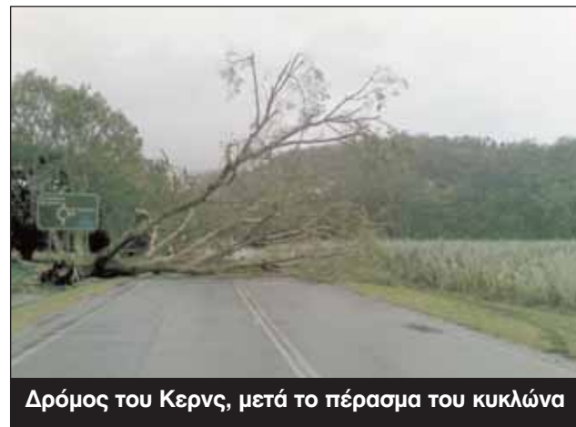
Δρόμος του Κερνς, μετά το πέρασμα του κυκλώνα

Μικρές ζημιές είχαν αναφερθεί χθες στο Mackay, ό-