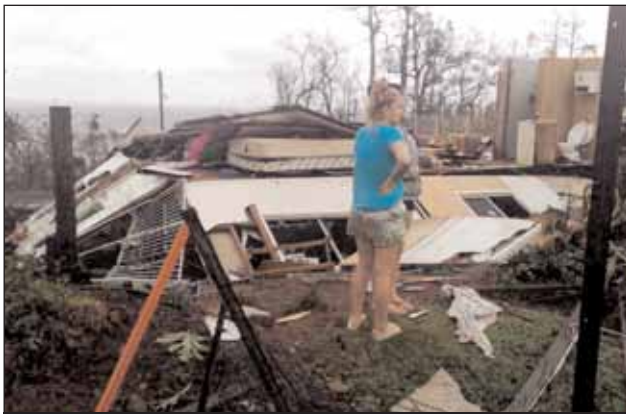
Ισοπεδωμένο σπίτι στο Mission Beach, όπου αναφέρθηκαν μεγάλες ζημιές στο 90% των κτιρίων της περιοχής

Άλλα δύο παιδιά γεννήθηκαν προχθές βράδυ, εν αναμονή του κυκλώνα Yasi, στο Νοσοκομείο του Ίνισφείλ.