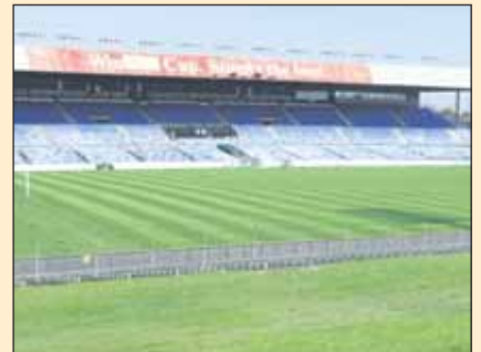
Belmore Sports Ground... «ΚΛΕΙΣΤΟ» λόγω επισκευών;

ΤΑ «ΛΑΜΟΓΙΑ», όπως χαρακτηριστικά τους αποκαλεί - και με το δικό του - ο Κώστας Μακρής. Τα «ΛΗΓΟΥΡΙΑ» όπως τους αποκαλεί ο υπογράφων τη στήλη.