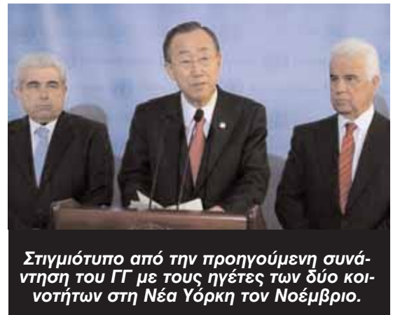
Στιγμιότυπο από την προηγούμενη συνάντηση του ΓΓ με τους ηγέτες των δύο κοινοτήτων στη Νέα Υόρκη τον Νοέμβριο.

Στη Γενεύη, ο Γενικός Γραμματέας των Ηνωμένων Εθνών, Μπαν Κι Μουν, θα παρου-