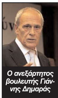
Ο ανεξάρτητος βουλευτής Γιάννης Δημαράς

Ο κ. Δημαράς ξεκαθάρισε ακόμη ότι δεν θα παραιτηθεί από τη Βουλή ούτε θα αποχωρήσει από το Περιφερια-