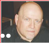
Του Γιώργου Σταυρουλάκη