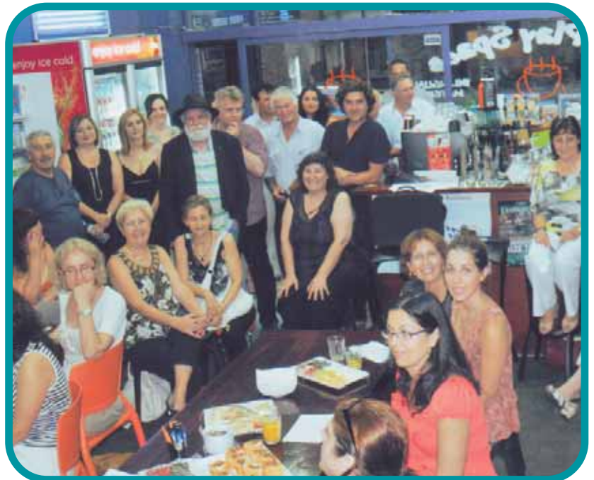
Άποψη του ακροατηρίου.