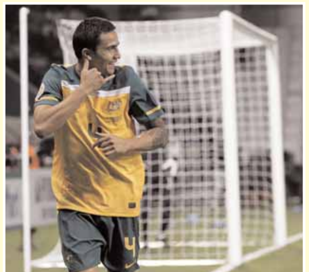
Ο διεθνής άσος της Έβερτον, Tim Cahill

Όλα τα χρήματα που θα δοθούν για την αγορά του πακέτου που προσφέρει ο Τιμ Κάχιλ θα δοθούν στον έρανο για τους πλημμυροπαθείς του Κουϊνσλαντ.