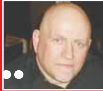
Του Γιώργου Σταυρουλάκη