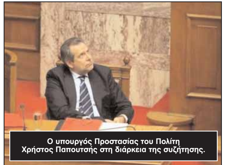
Ο υπουργός Προστασίας του Πολίτη Χρήστος Παπουτσης στη διάρκεια της συζήτησης.

Η ΝΔ ψήφισε το νομοσχέδιο για το άσυλο επί της αρχής του, αλλά και στο μεγαλύτερο μέρος των άρθρων του, όπως είπε η εισηγήτρια του κόμματος, Μαρία Κόλλια-Τσαρουχά, πλην όμως έκρινε ότι θα είναι αναποτελεσματικό, αφού από την άλλη πλευρά είτε προωθούνται νομοσχέδια περί ιθαγενείας που καθιστούν την Ελλάδα