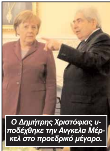
Ο Δημήτρης Χριστόφιας υποδέχθηκε την Άνγκελα Μέρκελ στο προεδρικό μέγαρο.

Ανέφερε ακόμη ότι ανέλυσε τη θέση της Κύπρου για