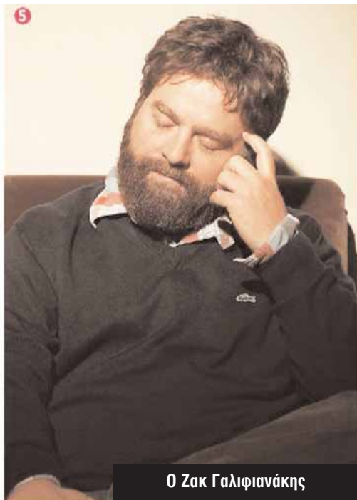
Ο Ζακ Γαλιφιανάκης