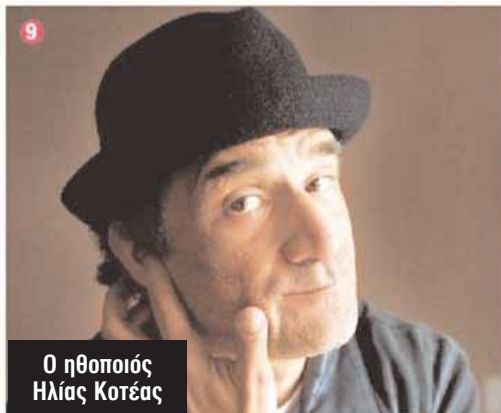
Ο ηθοποιός Ηλίας Κοτέας