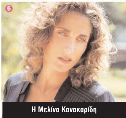
Η Μελίνα Κανακαρίδη