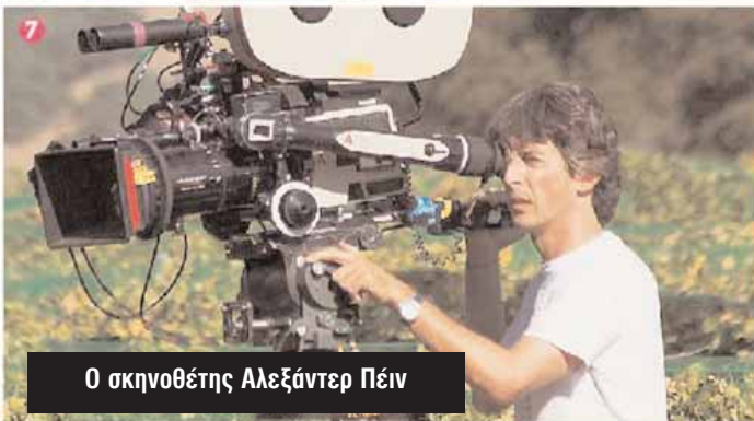
Ο σκηνοθέτης Αλεξάντερ Πέιν