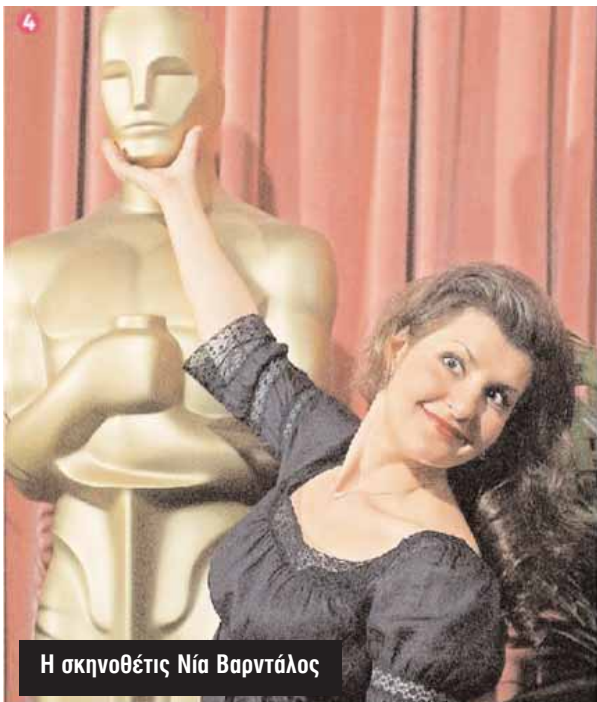
Η σκηνοθέτις Νία Βαρντάλος

Δεν πρέπει πάντως να ξεχνάμε και την προσφορά της Ρίτας Γουίλσον. Ή, αλλιώς, της Ελληνίδας Μαργαρίτας Γουίλσον, συζύγου του Τομ Χανκς και παραγωγού τόσο του «Big Fat Greek Wedding» όσο και του εξόχως... τουριστικού «Mamma Mia» με τη Μέριλ Στριπ!