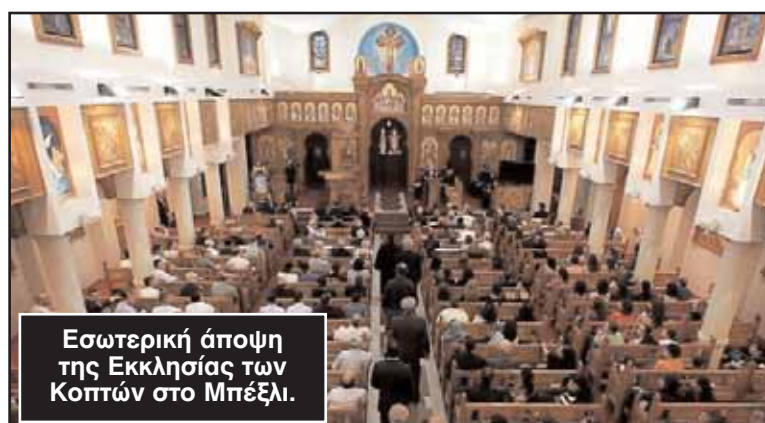
Εσωτερική άποψη της Εκκλησίας των Κοπτών στο Μπέξιλι.

ποία είχαν χάσει τη ζωή τους 21 άτομα. Σε ένδειξη στήριξης προς τους Κόπτες της Πολιτείας, ο πολιτειακός υπουργός Αστυνομίας, κ. Μάικλ Ντέιλι, παρακολούθησε τη λειτουργία το βράδυ της περασμένης Παρασκευής στην Κοπτική Εκκλησία του Μπέξιλι. Σημειώνεται ότι υπάρχουν 20 εκατομμύρια Κόπτες στον κόσμο, από τους οποίους 10 εκατομμύρια ζουν στην Αίγυπτο.