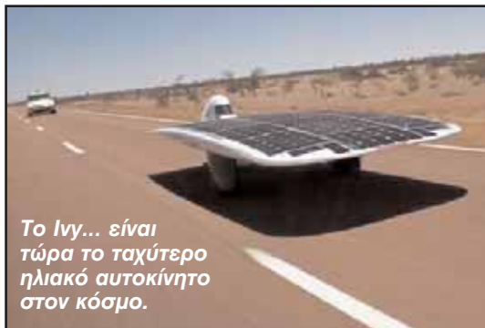
Το Ivy... είναι τώρα το ταχύτερο ηλιακό αυτοκίνητο στον κόσμο.

1951 - Γρηγόριος Ξενόπουλος, Έλληνας συγγραφέας και δημιουργός της «Διάπλασης των Παίδων».