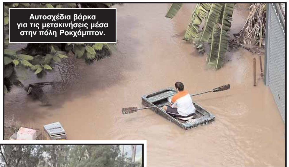
Αυτοσχέδια βάρκα για τις μετακινήσεις μέσα στην πόλη Ροκχάμπτον.

Η ομοσπονδιακή πρωθυπουργός, Τζούλια Γιλαντ, ανακοίνωσε το διορισμό του στρατηγού Μικ Σλέιτερ ως