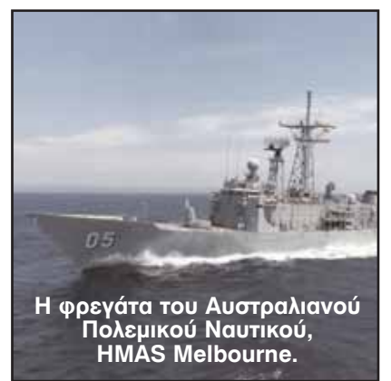
Η φρεγάτα του Αυστραλιανού Πολεμικού Ναυτικού, HMAS Melbourne.

Ο αντιναύαρχος Τζον Κάντγουελ δήλωσε ότι το προσωπικό του HMAS Melbourne αξίζει συγχαρητήρια για την προσφορά του στην αντιμετώπιση της πειρατείας.