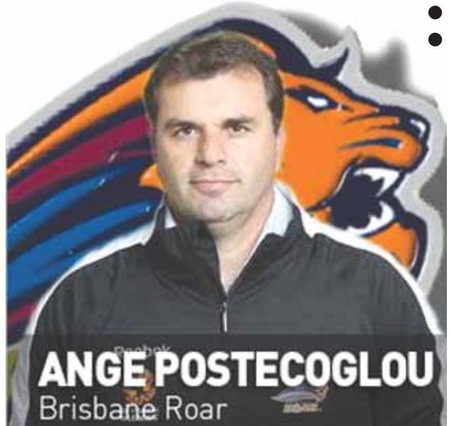
ANGE POSTECOGLOU Brisbane Roar

Θα μου λείψει αφάνταστα. ΑΓΓΕΛΟΣ ΠΟΣΤΕΚΟΓΛΟΥ