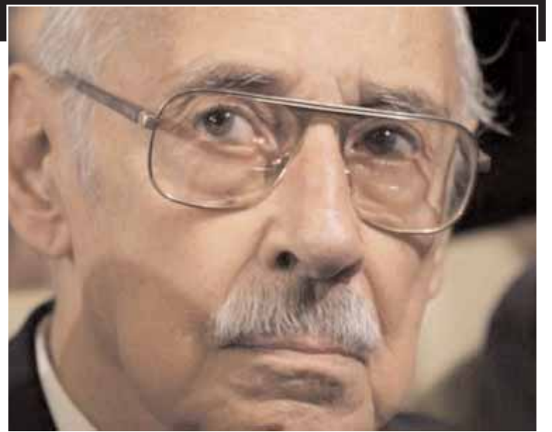
«Η χώρα διοικείται από τρομοκράτες» ανέφερε προκλητικά στο δικαστήριο ο πρώην δικτάτορας.

Κατά τη δίκη, ο συγκατηγορούμενός του Μενέντεζ υπερασπίστηκε εαυτόν λέγοντας πως οι φυλακισμένοι είχαν διαπράξει εγκλήματα ήδη πριν από το πραξικόπημα, χαρακτηρίζο-