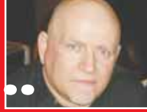
Του Γιώργου Σταυρούλακη