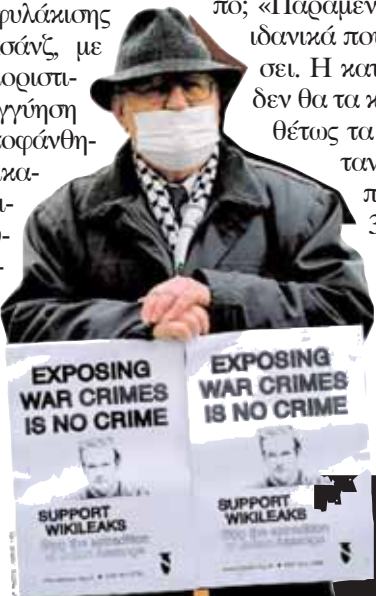
«Η αποκάλυψη εγκλημάτων πολέμου δεν είναι έγκλημα» γράφει το πλακάτ του διαδηλωτή, ενός από τους δεκάδες που βρέθηκαν έξω από το δικαστήριο του Γουέστμινστερ.