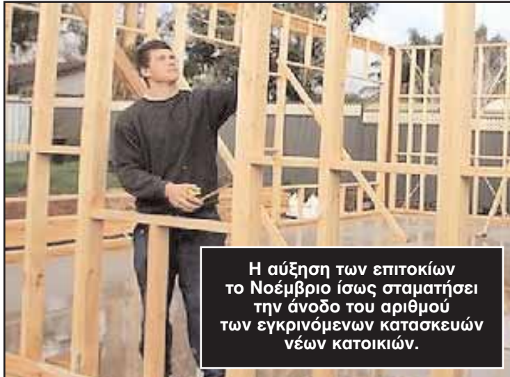
Η αύξηση των επιτοκίων το Νοέμβριο ίσως σταματήσει την άνοδο του αριθμού των εγκρινόμενων κατασκευών νέων κατοικιών.

Ο διευθυντής της εταιρείας Citigroup Global Markets, κ. Πολ Μπρέναν, δήλωσε ότι ο αριθμός των νέων εγκρίσεων αδειών για διαμερίσματα στη Νέα Νό-