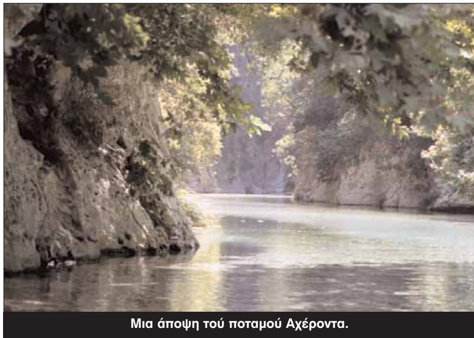
Μια άποψη τού ποταμού Αχέροντα.