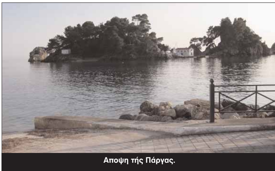
Αποψη τής Πάργας.

σης. Γι' αυτό ο Πυριφλεγέθων είναι γνωστός και ως πύρινος ποταμός.