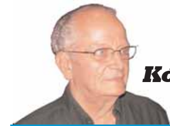
Επιμέλεια ΓΙΩΡΓΟΥ ΧΑΤΖΗΒΑΣΙΛΗ

Το όνομά του προέρχεται από τη λέξη κωκύω που σημαίνει θρηνώ και υποδηλώνει τους επιθανάτιους θρήνους. Ο Πυριφλεγέθοντας πήγαζε από το σημείο που βρίσκεται η Μονή Αγίας Παρασκευής Μπούντας και