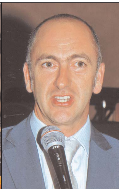
Ο δήμαρχος Καντερμπέρι, Ρόμπερτ Φουρόλο.