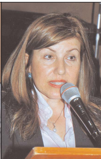
Η βουλευτής της Άνω Βουλής ΝΝΟ, Σοφία Κώτση