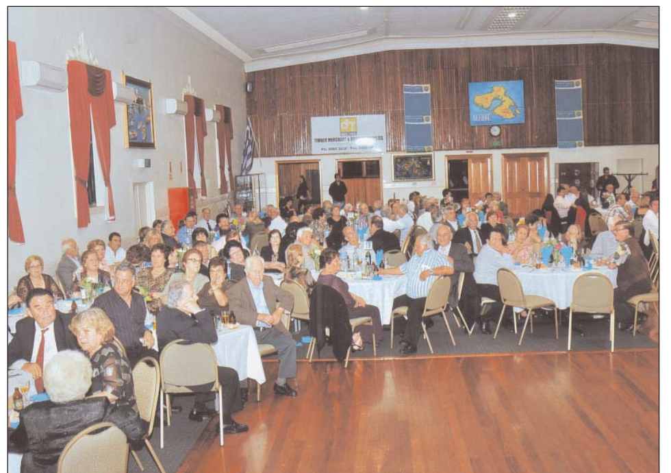
Σχεδόν γεμάτη ήταν η αίθουσα του Μυτιληνιακού Σπιτιού.