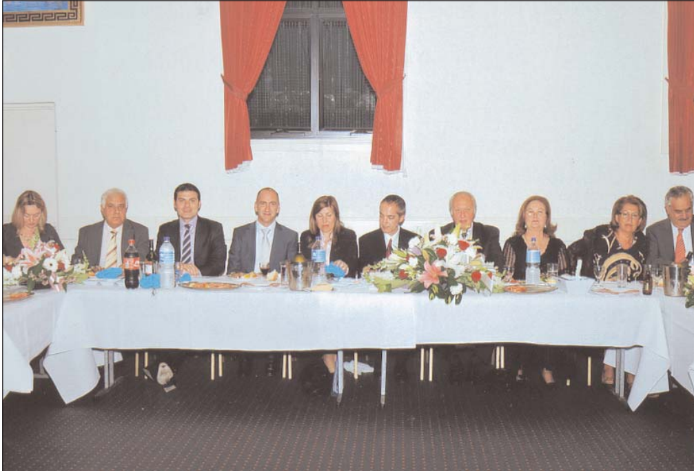
Το τραπέζι των επίσημων προσκεκλημένων