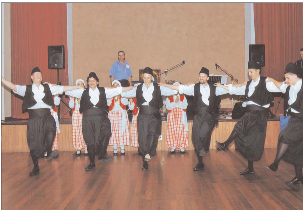
Το χορευτικό παρουσίασε παραδοσιακούς χορούς.