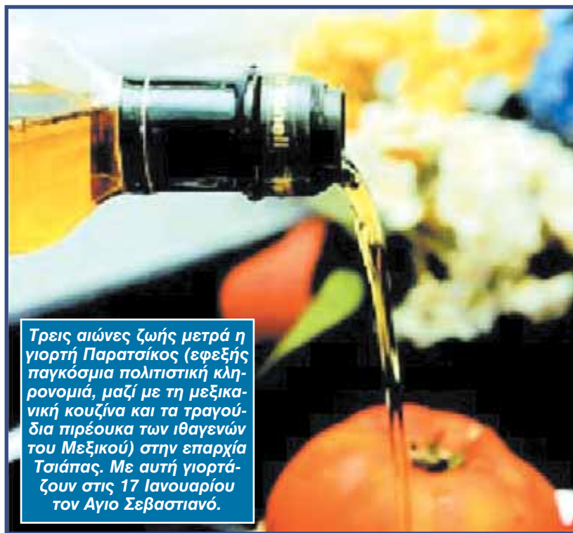
Τρεις αιώνες ζωής μετρά η γιορτή Παρασίκος (εφεξής παγκόσμια πολιτιστική κληρονομιά, μαζί με τη μεξικανική κουζίνα και τα τραγούδια πιρέουκα των ιθαγενών του Μεξικού) στην επαρχία Τσιάπας. Με αυτή γιορτάζουν στις 17 Ιανουαρίου τον Άγιο Σεβαστιανό.

Η έννοια της Αΰλης ή Πνευματικής Πολιτιστικής Κληρονομιάς της Ανθρωπότητας, τμήμα της Παγκόσμιας Κληρονομιάς της UNESCO, υιοθετήθηκε τη δεκαετία του 1990 και περιλαμβάνει διάφορες πτυχές του πολιτισμού, από τον χορό και τη μουσική έως διάφορες μορφές έκφρασης και παραδόσεις, τελετουργίες ή γιορτές που χαρακτηρίζουν μια ομάδα. Η λίστα περιελάμβανε 166 θησαυρούς από 77 χώρες και προστέθηκαν, μεταξύ των άλλων, τα κροατικά λαϊκά τραγούδια, ένας αρχαίος χορός των Ουιγούρων και το τουρκικό φρεστιβάλ πάλης των μεχλιβάνηδων που αλείφονται με λάδι.