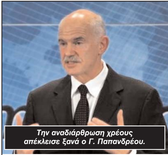
Την αναδιάρθρωση χρέους απέκλεισε ξανά ο Γ. Παπανδρέου.

Ο πρωθυπουργός στάθηκε κυρίως στην αποκατάσταση της αξιοπιστίας της χώρας, σημειώνοντας ότι μέσα στο χρόνο θα έχει επιτευχθεί μείωση του ελλείμματος κατά 6%, ενώ τόνισε ότι από το 2012 η Ελλάδα θα αρχίσει την αποπληρωμή των δανείων και την μείωση του χρέους της. Ο Γ. Παπανδρέου ανέφερε επίσης πως ιδιαίτερα η εξάλειψη της αδιαφάνειας θα ωφελήσει την ελληνική οί-