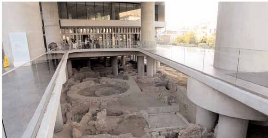
Το μουσείο της Ακρόπολης είναι το καλύτερο μουσείο του κόσμου

Η βράβευση απέσπασε ευμενή σχόλια σε τηλεοπτικούς σταθμούς της Μεγάλης Βρετανίας, με την επισήμανση ότι το γεγονός δίνει νέα δυναμική στο αίτημα της επιστροφής των μαρμάρων στην Ελλάδα, όπως ανέφεραν Βρετανοί σχολιαστές.