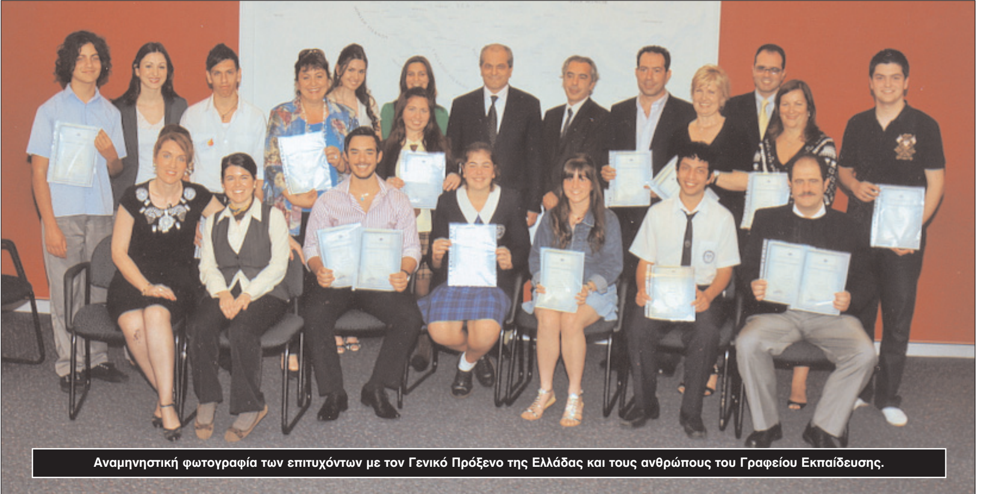
Αναμνηστική φωτογραφία των επιτυχόντων με τον Γενικό Πρόξενο της Ελλάδας και τους ανθρώπους του Γραφείου Εκπαίδευσης.

Τους επιτυχόντες και τους παραβρισκόμενους χαιρέτησε κι ο Γενικός Πρόξενος της Ελλάδας στο Σίδνεϊ, Βασίλειος Τόλιος, ο οποίος αναφέρθηκε στην προσπάθεια που έγινε και στην σημασία της απόκτησης του πιστοποιητικού ελληνομάθειας.