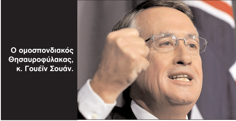
Ο ομοσπονδιακός Θησαυροφύλακας, κ. Γουέιν Σουάν.