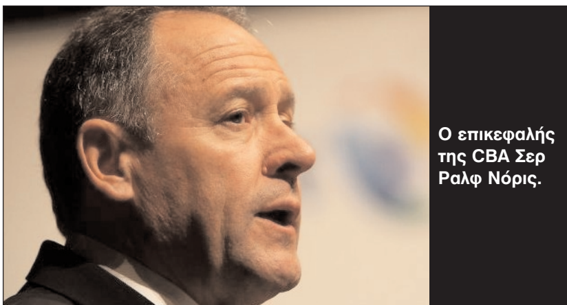
Ο επικεφαλής της CBA Σερ Ραλφ Νόρις.

Το Συμβούλιο Μικρών Επιχειρήσεων Αυστραλίας ζητά από την ομοσπονδιακή κυβέρνηση να καθιερώσει δια νόμου την μεταφορά λογαριασμών από τράπεζα σε τράπεζα χωρίς να αλλάζουν οι αριθμοί των λογαριασμών (όπως γίνεται με τους αριθμούς των κινητών τηλεφώνων) και παράλληλα να απλοποιήσει τις γραφειοκρατικές διαδικασίες. Ιδιαίτερα αναφέρθηκε ότι οι γραφειοκρατικές διαδικασίες αποθαρρύνουν την αλλαγή των τραπεζών και τη μεταφορά των λογαριασμών σε τράπεζες που καταβάλουν υψηλότερο επιτόκιο για τις καταθέσεις και χρεώνουν μικρότερα τέλη για τα δάνεια.