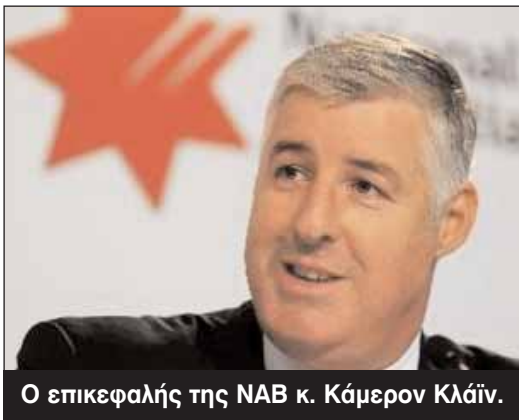
Ο επικεφαλής της NAB κ. Κάμερον Κλάιν.

Σε ερώτηση του ραδιοφωνικού προγράμματος του SBS, εάν υπάρχει περίπτωση η τελική απόφαση του υπουργείου να μην είναι σύμφωνη με την έκθεση της Επιτροπής ACARA, αναφέρθηκε ότι κάτι τέτοιο «είναι απολύτως αδύνατον να συμβεί». Ως γνωστόν για το θέμα είχε κινητοποιηθεί σύσσωμη η ομογένεια μέσω των φορέων της. Όπως ειπώθηκε από εκπαιδευτική πηγή, η Επιτροπή των Εμπειρογνομόνων που συνέταξε το κείμενο της εισήγησης, εξ αρχής υπολόγιζε την ελληνική γλώσσα να είναι μέσα στο εθνικό πρόγραμμα διδασκαλίας. Αυτό αποδίδεται στην παναυστραλιανή σημασία της ελληνικής, στην εδραιωμένη διδακτική υποδομή για τη γλώσσα μας, στον ικανοποιητικό αριθμό δασκάλων και τέλος στο γεγονός ότι είναι μία από τις πλέον ομιλούμενες γλώσσες στην κοινωνία γύρω από το σχολείο.