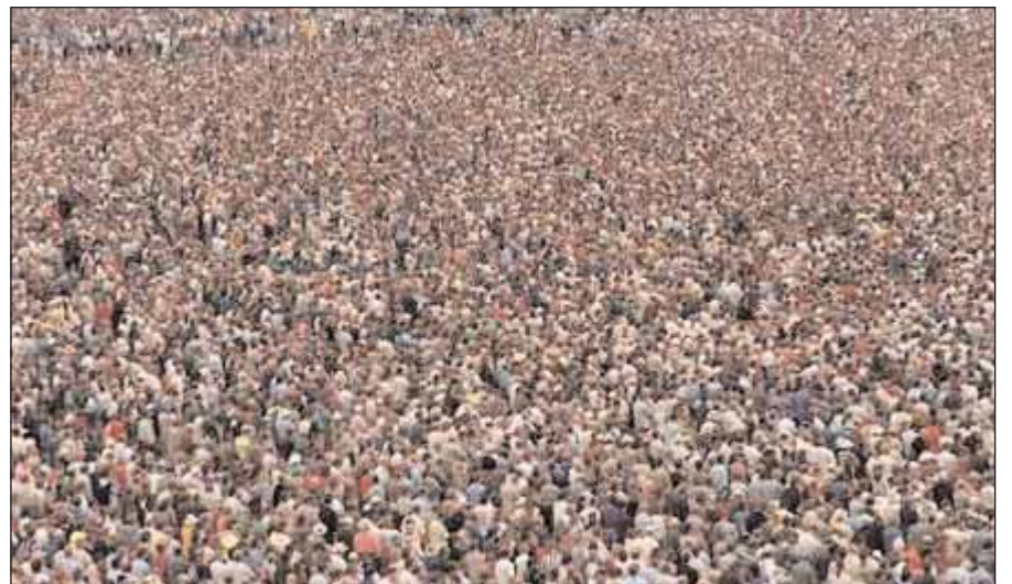
«Ο πληθυσμός της γης έφθασε τα επτά δισεκατομμύρια...»

Ο καθηγητής του Εθνικού Πανεπιστημίου της Αυστραλίας, Ίαν Μακάλιστερ, ο οποίος ήταν επικεφαλής της έρευνας, δήλωσε ότι το κοινό αντιτίθεται στην αύξηση του πληθυσμού για πολλούς και διάφο-