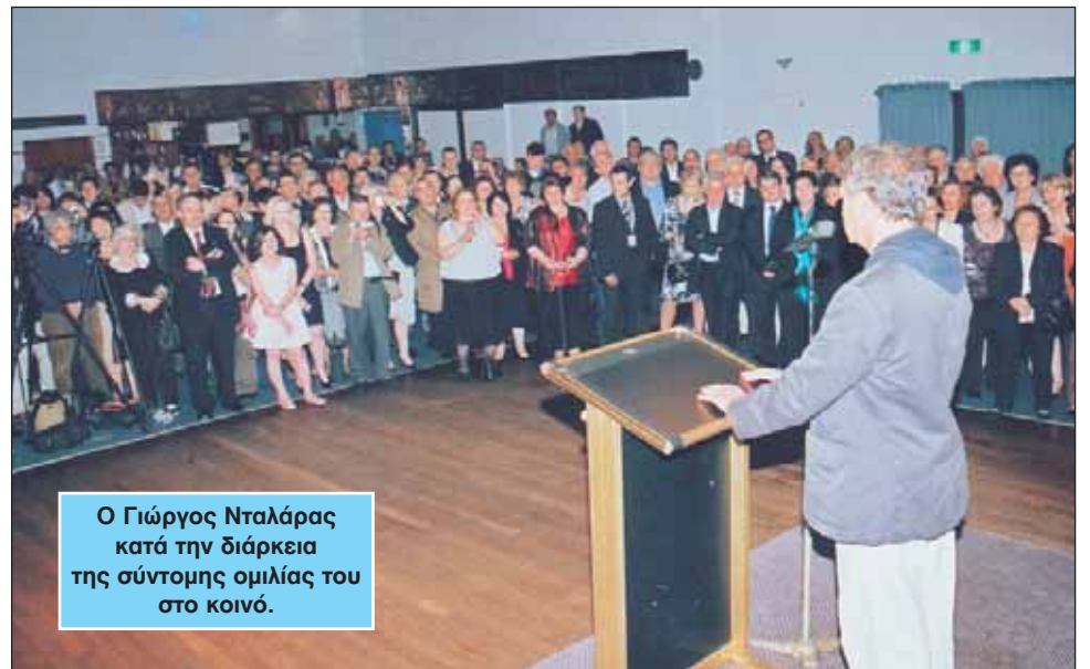
Ο Γιώργος Νταλάρας κατά την διάρκεια της σύντομης ομιλίας του στο κοινό.